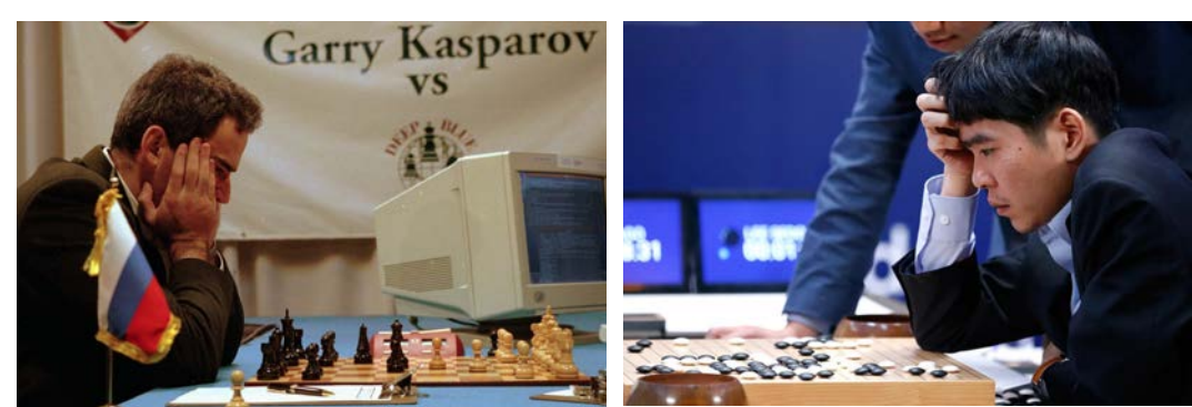
Abbildungen: Künstliche Intelligenzen "AlphaZero" und "AlphaGo" besiegen Weltmeister in Schach und Go → Spiele bieten gute Grundlage um an KI's zu forschen, weil abgegrenzte Umgebung mit klaren Regeln

Mit dem Thema dieses Posters haben sich meine Gruppe und ich auch in unserer Seminarfacharbeit beschäftigt. Sie trägt den Titel: "Verschiedene Methoden zur Strategieoptimierung und deren Vergleich" und es folgt eine kleine Zusammenfassung unserer Arbeit.